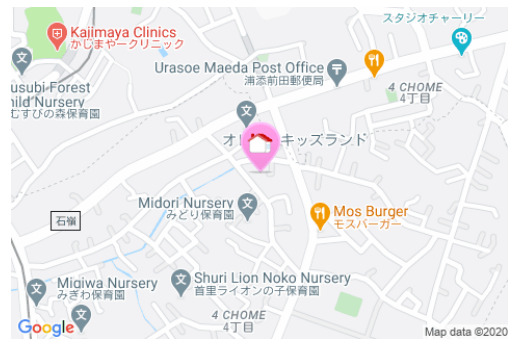
【バス停】厚生園入口／徒歩約3分