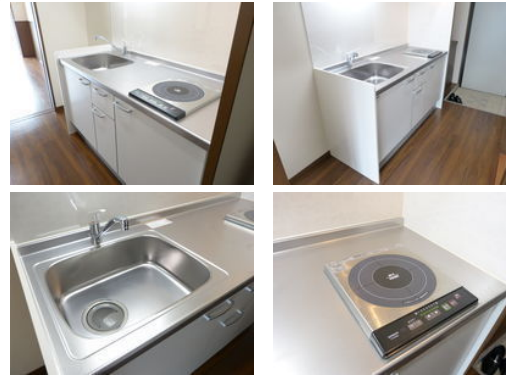
【バス停】那覇バス 寄宮中学校前停 / 徒歩約5分