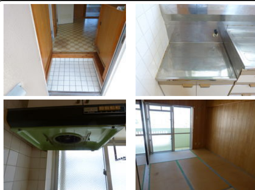
【バス停】国場十字路/徒歩約4分