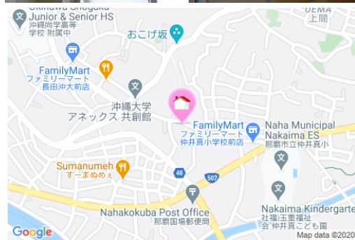
【バス停】国場十字路口/徒歩約4分