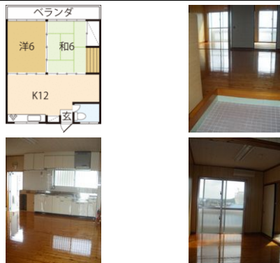
【バス停】上間／徒歩約4分