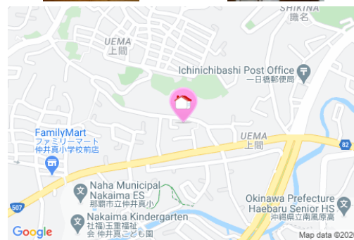
【バス停】上間 / 徒歩約4分