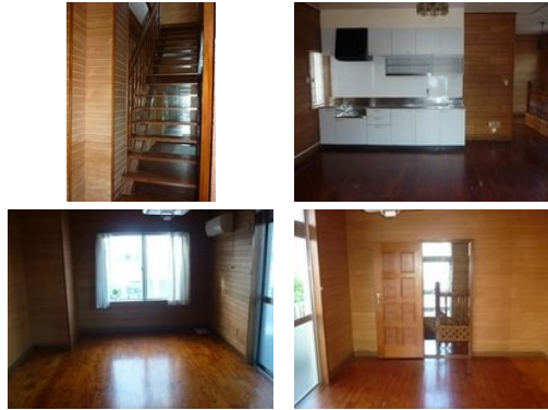
【バス停】根差部入口ノ徒歩約7分