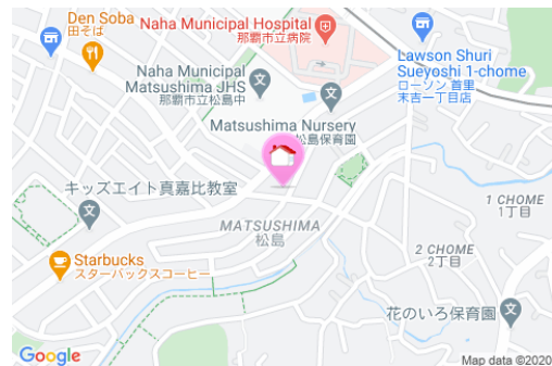
【モノレール】市立病院前駅／徒歩約8分