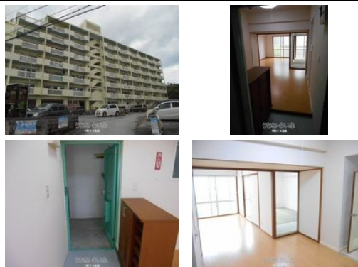
【バス停】第一天久バス停／徒歩約2分