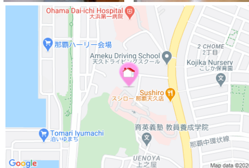
【バス停】第一天久バス停 / 徒歩約2分