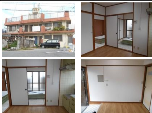
【バス停】 仲西原 / 徒歩約5分