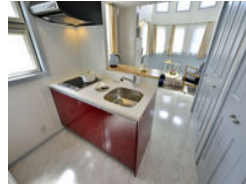
【モノレール】県庁前駅／徒歩約5分