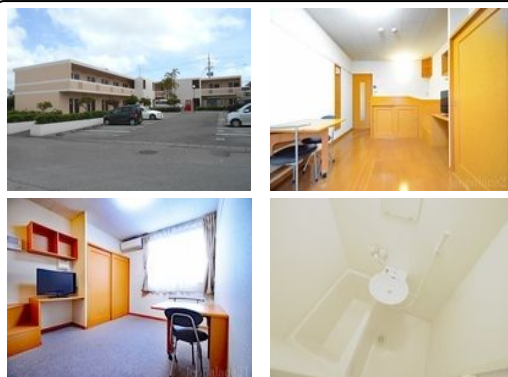
【バス停】美里団地入口／徒歩約4分