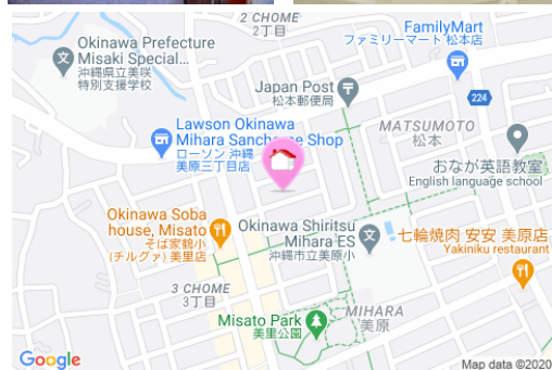
【バス停】美里団地入口／徒歩約4分