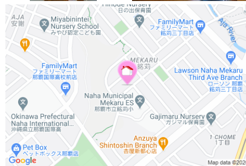
【モノレール】古島駅／徒歩約11分