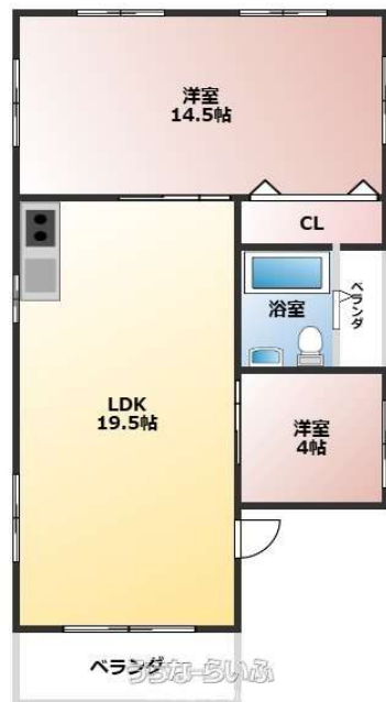
Maison La Mer メゾンラメール

★1世帯ワンフロアのオーシャンビュー物件★室内広々としたLDK19.5帖★各部屋にエアコン付き★宮城 海岸まで50mと海の近く★風通し、眺望よし★お問い合わせお待ちしております★