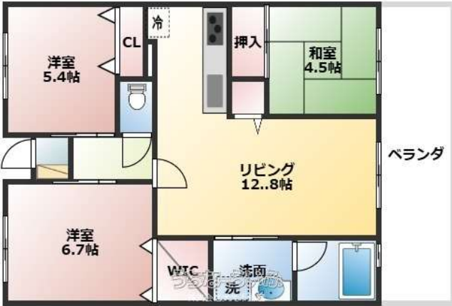
プレサンスロジエ宜野湾レーヴ 703

★7階のお部屋で眺望良好★3LDK、駐車場2台有り★共用1階部分スタディールーム有り★目の前にスーパー有、車で5分圏内に郵便局、銀行、コンビニ、ボウリング場など商業施設が多数あり生活に便利な立地♪☆24時間ゴミ出し可能★