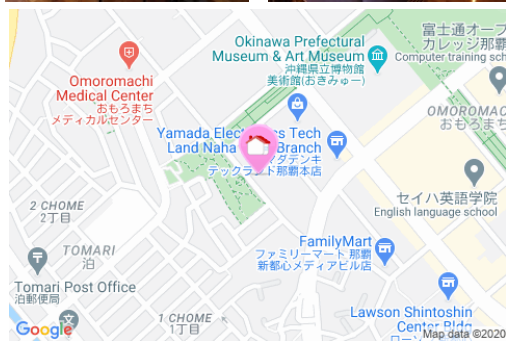
【モノレール】おもろまち駅／徒歩約12分