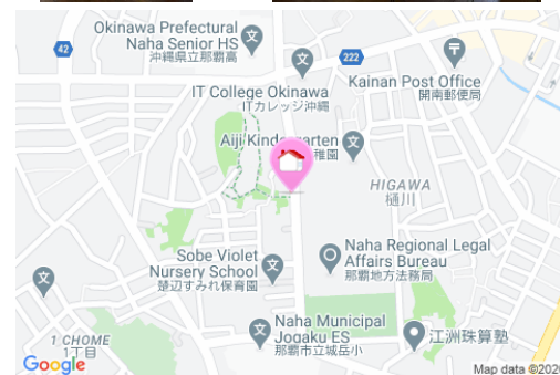
【モノレール】県庁前駅／徒歩約15分