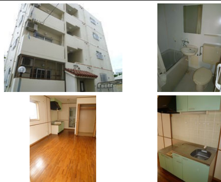
【モノレール】安里駅／徒歩約10分 【バス停】神原／徒歩約2分