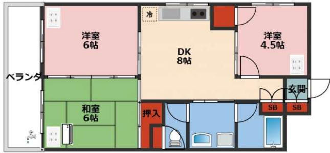
ひろ荘 2-A ※現況と間取りが相違する場合は現況を優先します

【ペット可！※小型犬or猫1匹のみとなります。】★大切な家族の一員、ペットとも一緒に暮らせるお部屋です♪宜野湾小学校目の前で、お子さまの通学も安心の住環境。2階角部屋で風通しも良く、駐車場2台付きなの嬉しいポイント♪暮らしやすい設備が揃ったファミリーおすすめ物件です！