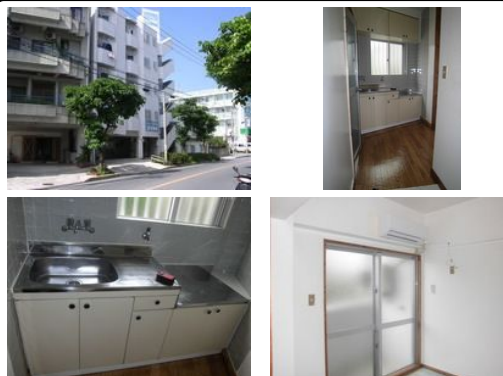
【モノレール】儀保駅ノ徒歩約7分