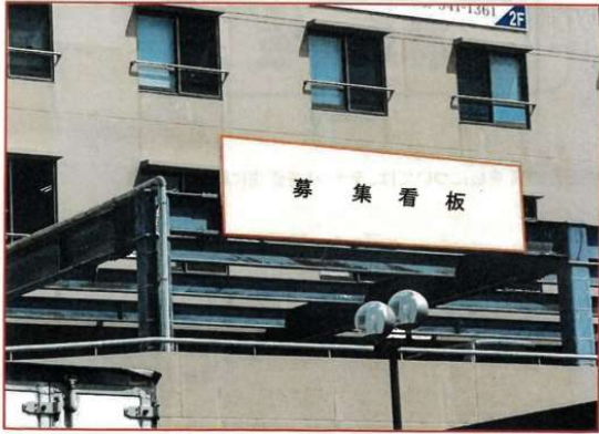
貸看板寸法 幅 5.50m × 高 1.50m

【1 枠広告募集】那覇中心エリア・国道330沿い・おもろまち駅徒歩圏内、通行量が多い好立地に広告を出してみませんか(^^) / 広告主募集中です。お気軽にお問い合わせください！