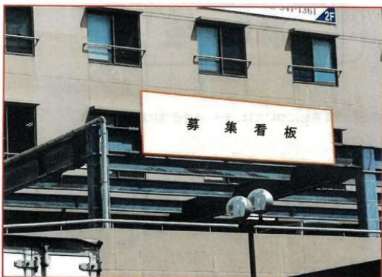
貸看板寸法 幅 5.50m × 高 1.50m

【1 枠広告募集】那覇中心エリア・国道330沿い・おもろまち駅徒歩圏内♪通行量が多い好立地に広告を出してみませんか(^^) / 広告主募集中です。お気軽にお問い合わせください！