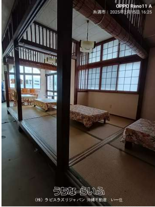
OPPO Reno11 A 糸満市 | 2025年6月15日 16:25

学習塾、学童保育に最適な西崎小学校目の前の立地。事業に優位な視認性と環境。飲食店設備有。現状渡しですが業種によりご相談賜ります。