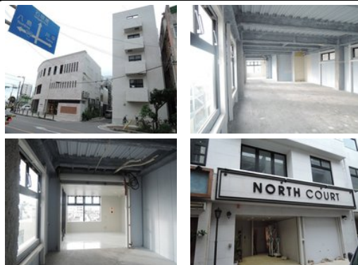
【バス停】離島ターミナルノ徒歩約3分