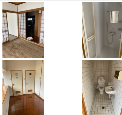
【モノレール】赤嶺駅／徒歩約23分 【バス停】高良／徒歩約9分