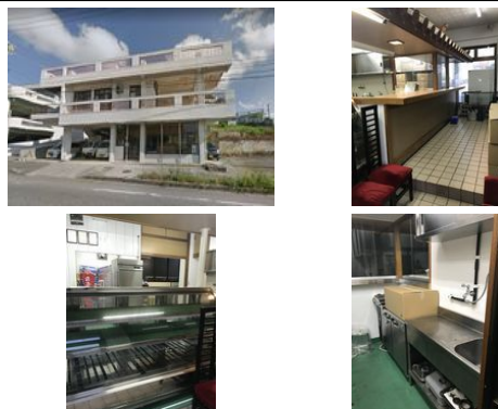
【バス停】北中城小学校入口／徒歩約2分