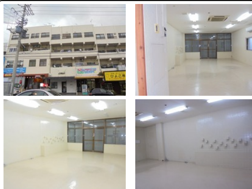
【バス停】 宇地泊 / 徒歩約3分