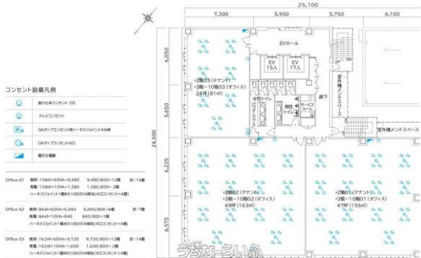
2階(テナント)及び2~10(オフィス)階平面図

7階オフィス約47坪になります。天井高2.85m！2室利用可能です。那覇メインプレス向かいに安心・安全を兼ね備えた省エネ新築オフィスビルが完成しました。お気軽にお問い合わせください。