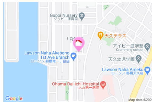
【バス停】倉庫前／徒歩約8分