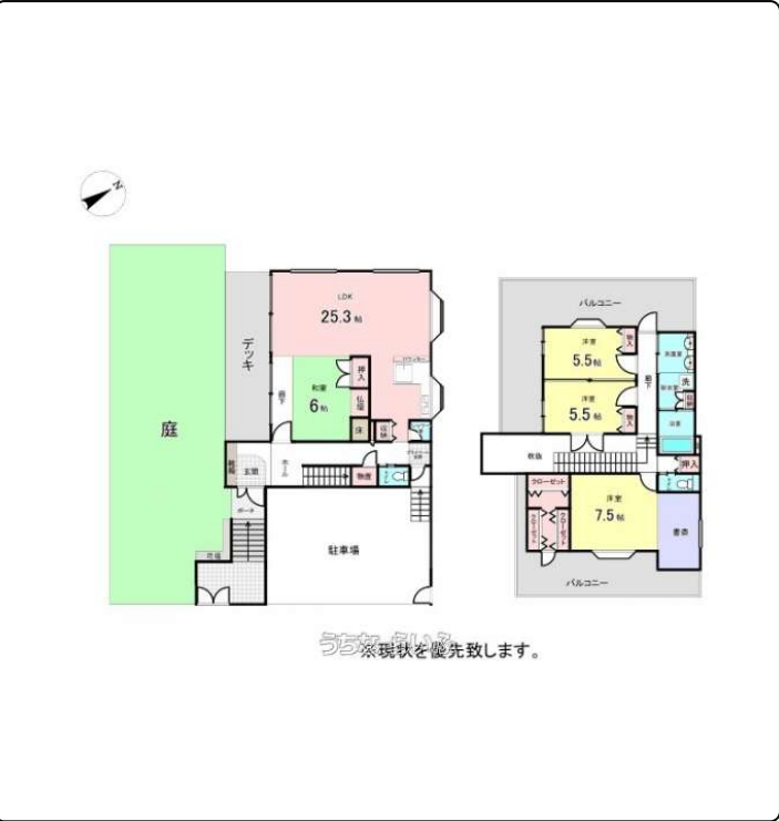
※現状を優先致します。

おすすめ物件！オシャレな吹抜けの玄関・広々とした間取りで快適にお過ごしいただけます住宅ローンのご相談から購入までの流れ、月々のご相談もお客様に合ったプランをご提案お家探し初めての方、ずっと探している方！どんな方でも大歓迎です♪詳しくはお気軽にお問い合わせください♪