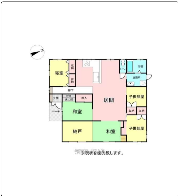
※現状を優先致します。

おすすめ物件平屋のお家です♪駐車場も5~6台並列可能一部カーポート付き！『住宅ローンのご相談から購入までの流れ、月々のご相談もお客様に合ったプランをご提案お家探し初めての方、ずっと探している方！どんな方でも大歓迎です♪詳しくはお気軽にお問い合わせください♪