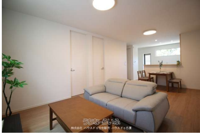
うちなーらいふ 株式会社 ハウスの住宅販売 ハウスの賃貸