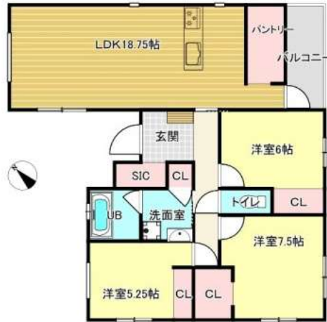
90.26m 2 / 27.3坪