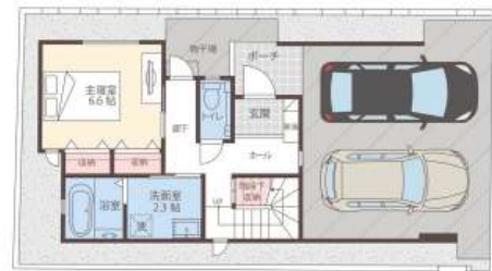
クローバーエース北谷吉原Ⅲ 2号棟

【2号棟/全2棟】令和8年6月完成予定の新築戸建て、先行公開♪2階リビング・ファミリークローゼット有！ビルトインガレージ付きで2台駐車可能！（車種要確認）お気軽にお問い合わせください【※仲介業者紹介可】