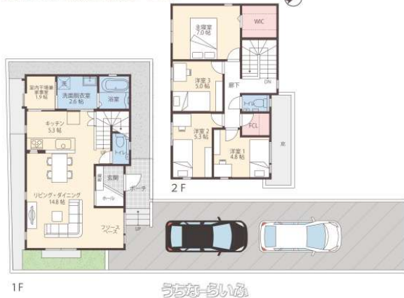
FINE STAR 西原町上原分譲 1号地