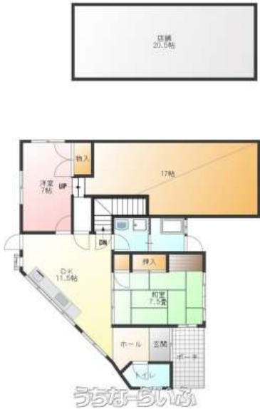
【読谷村字波平 260-1 (土地・建物)】

【大幅減額しました！！】 県道6号線沿い！店舗賃料月額75,000円！必見です！ 住居部分は空家なので、いつでも内覧可能です！ お気軽にお問い合わせ下さい！