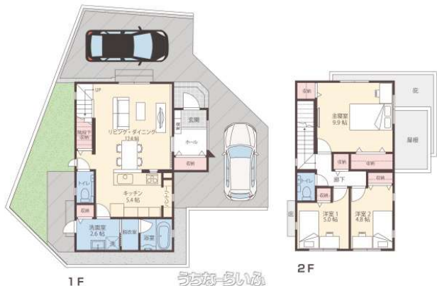
FINE STAR 南風原宮平 I 3号地

注文住宅で好評だったプランが詰め込まれた間取りを採用。南風原北ICまで車で約4分（約1.3km）小学校やスーパーなど生活利便性の高いロケーション！