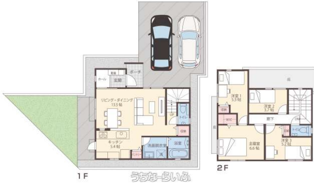
FINE STAR 南風原宮平 I 2号地

【商談中】注文住宅で好評だったプランが詰め込まれた間取りを採用。南風原北ICまで車で約4分（約1.3km）小学校やスーパーなど生活利便性の高いロケーション！