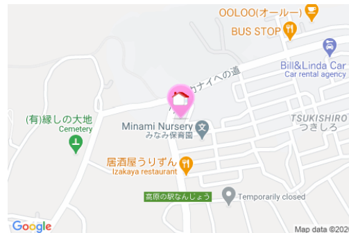
【バス停】西つきしろ / 徒歩約3分