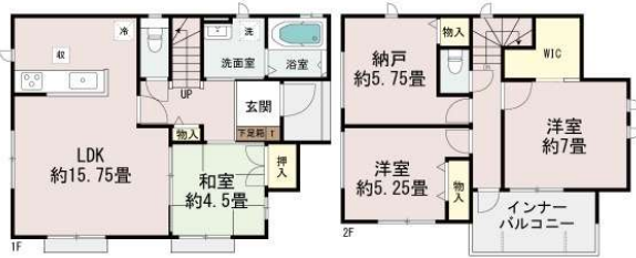
うるま市江洲/全10棟

【うるま市江洲G号棟】同エリア10棟"すべて比較可能"家族に合う1棟を選べます！