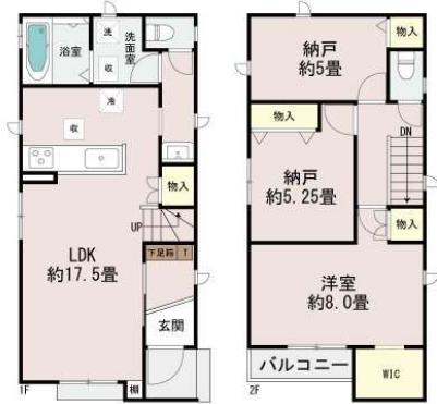
うるま市江洲/全10棟

【うるま市江洲F号棟】同エリア10棟"すべて比較可能"家族に合う1棟を選べます！