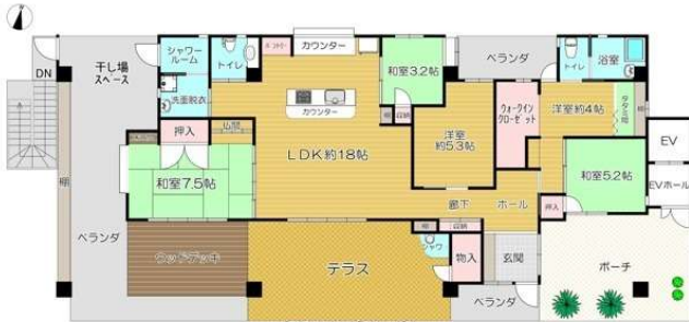
住宅 3F ※現況と間取図が異なる場合は、現況を優先致します。