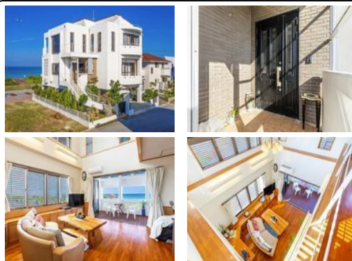
【バス停】糸満営業所／徒歩約14分