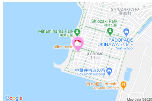
【バス停】糸満営業所／徒歩約14分