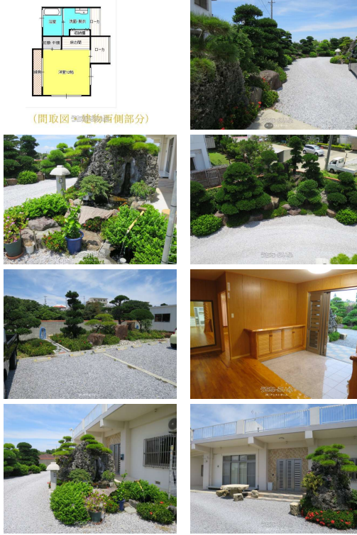
(間取図は建物西側部分)