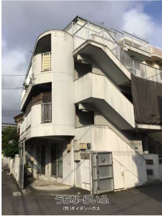
うちなーらいふ (有)ダイデンハウス