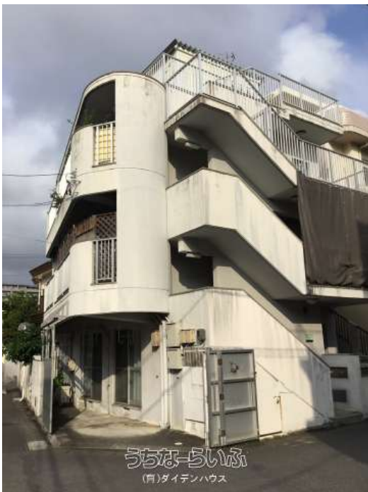
うちなーらいふ (有)ダイデンハウス